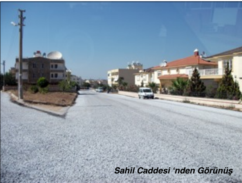
Sahil Caddesi 'nden Görünüş

Didim Belediyesi Fen İşleri Müdürlüğü tarafından yürütülen yol asfaltlama çalışmaları devam ediyor.