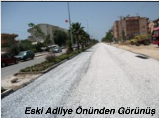
Eski Adliye Önünden Görünüş

548, 557, 558, 559, 566, 567, 569, 570. Sokaklar, 2249. Sokak, Abalı Kavşağı, Ege Caddesi - Mahir Özgür Damar İlköğretim Okulu arası, Eski Adliye Önü, Karadeniz Caddesi, Sahil Caddesi, Selçuk Özsoy Caddesi, Selvi Caddesi - Mahir Özgür Damar arası, Selvi Caddesi - Ege Caddesi arası.