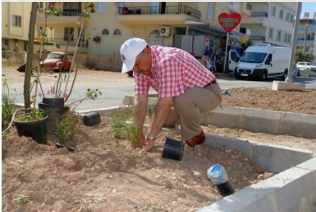
Başkanımız Mümin Kamacı'yı herkesten uzakta tüm dikkatiyle çiçek dikerken yakaladık.

Personeliyle birlikte çiçek dikimine katılan Belediye Başkanımız Mümin Kamacı, "Diktiğimiz ağaçlar büyüdüğünde bu caddelerimize, bulvarlarımıza ayrı bir güzellik katacaktır. Bizim görevimiz fidanları toprakla buluşturmak, vatandaşlarımızın görevi ise onları korumak, kollamaktır. Bir kuşağın diktiği ağacın gölgesinde başka bir kuşağın dinlenmesi için ağaçlarımızı korumalıyız" diyerek duygularını ifade etti. Çok sayıda Belediye personelinin eşleri ve çocuklarıyla birlikte katıldığı çiçek ve fidan dikimi etkinliği boyunca espiriler ve kahkahalar hiç eksik olmadı. Mesai bitimi sonrasında başlayan etkinlik boyunca arabalarıyla bulvardan geçen vatandaşların bir kısmı meraklı gözlerle bakarken, bir kısım vatandaşımız arabalarından inerek ya da evlerinden çıkarak Belediye çalışanları ile birlikte çiçek dikmeye başladılar.