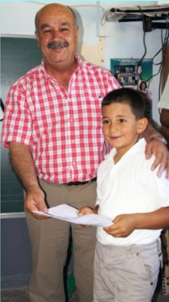
Belediye Başkanımız öğrencilerle karne sevincini paylaştı.

Didim Belediyesi İmar İşleri Müdürlüğü'ne bağlı KUDEB Bürosu tarafından takip edilen kazı çalışmalarının hızlandırılması için Milet Müze Müdürlüğü'ne gerekli tüm teknik ve lojistik destek Belediyemiz tarafından sağlanmaktadır. Önümüzdeki günlerde yeniden başlaması planlanan sondaj kazı çalışmalarının sonuçlanmasından sonra bu konunun da çözüme kavuşturulması hedeflenmektedir.