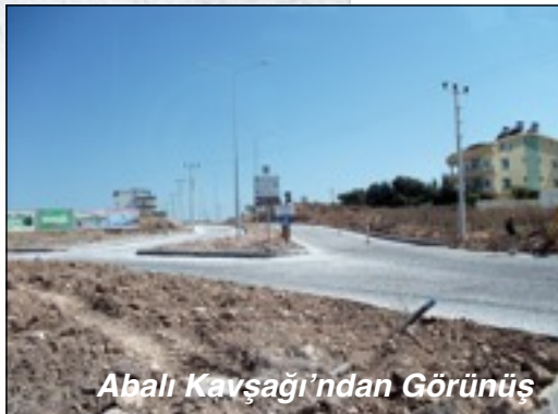
Abalı Kavşağı'ndan Görünüş