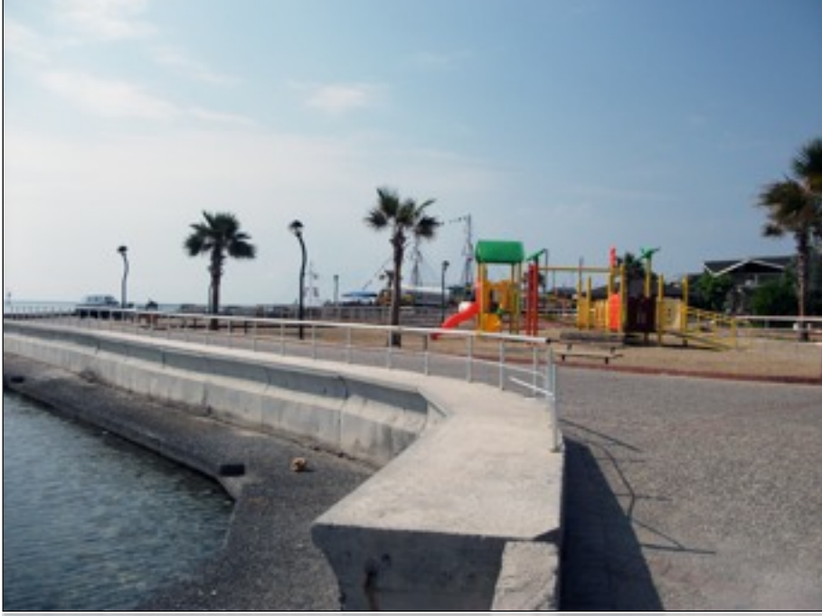
Alüminyum korkuluklar engelli vatandaşlarımızın rahatça denize ulaşmasını sağlayacak.