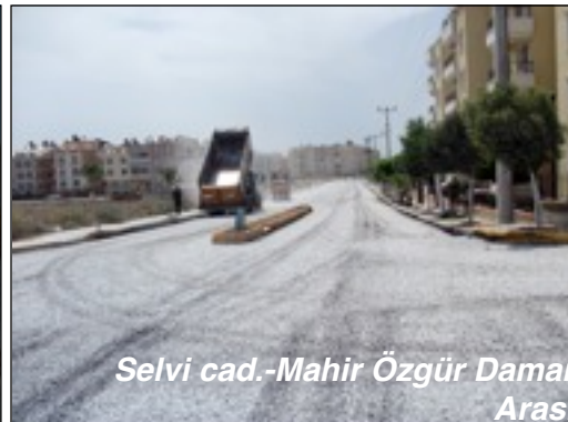
Selvi cad.-Mahir Özgür Damar Arası