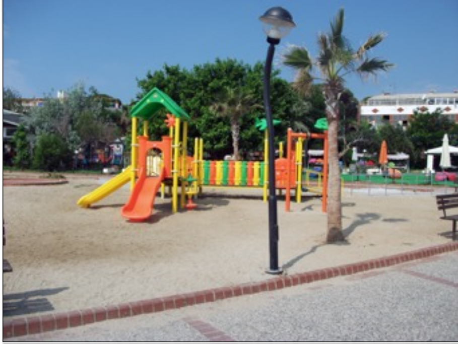
Engelli çocuklarımız için özel oyun grubu da bulunuyor.

Belediyemiz Türkiye'de eşine az rastlanır bir sosyal sorumluluk örneğine ve uygulamasına daha imza attı.