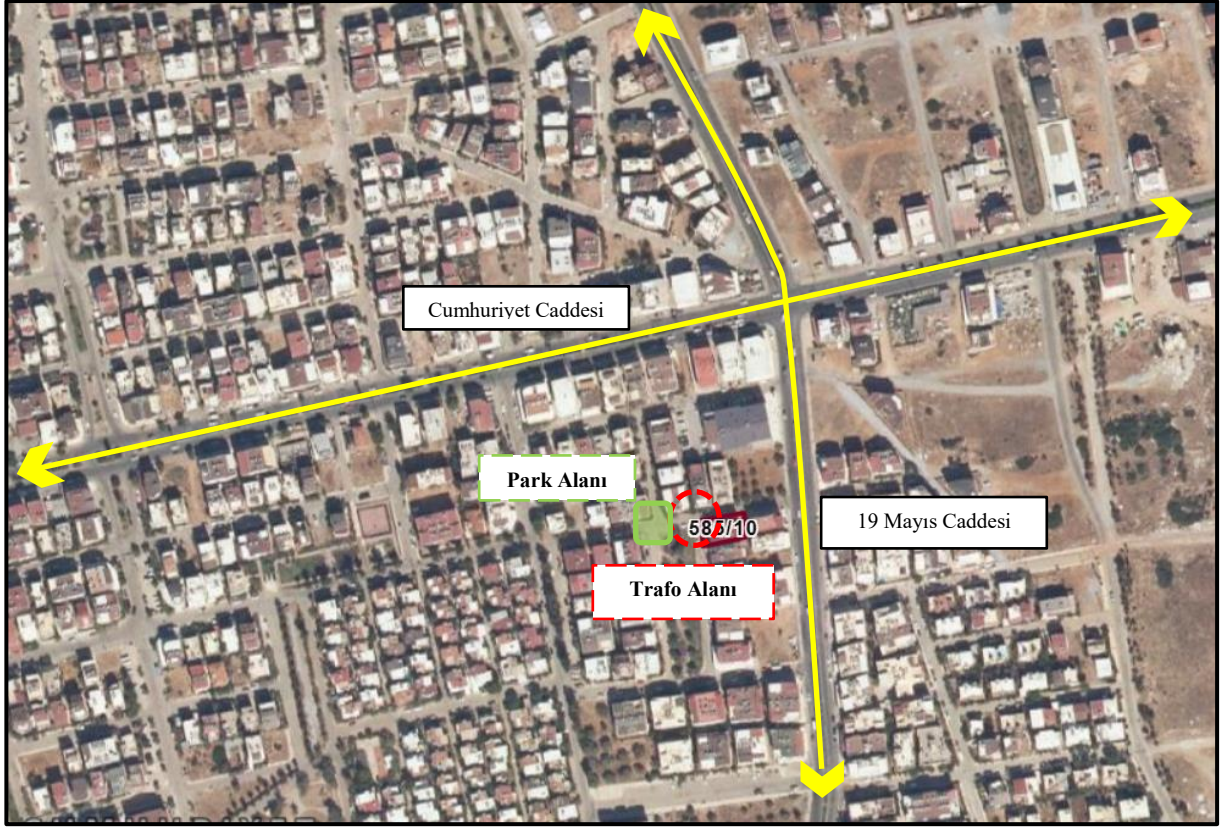
Görüntü 1: Plana Konu Alanların Uydu Görüntüsü Üzerindeki Yakın Konumu